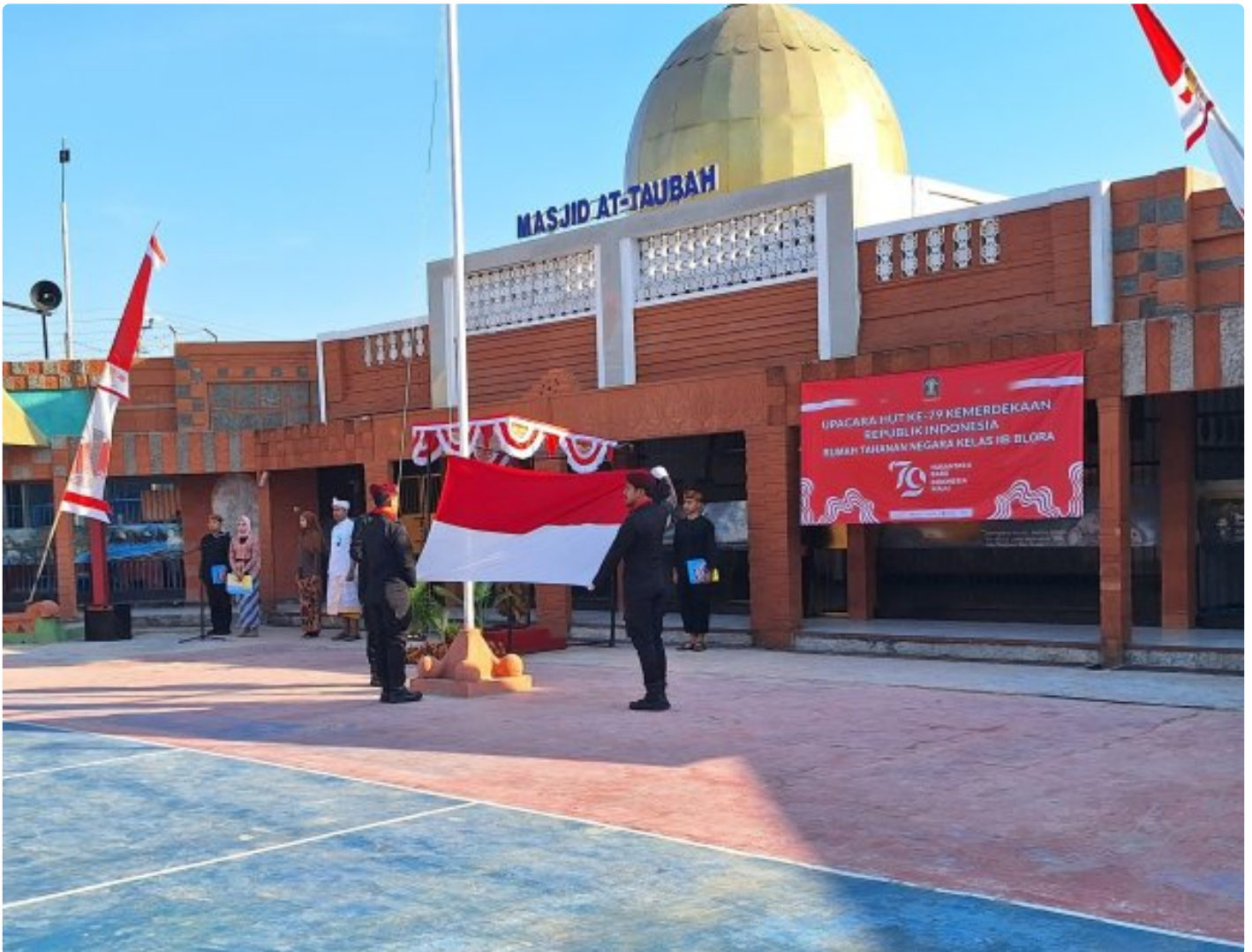
Rutan Blora Gelar Upacara Peringatan HUT ke-79 Kemerdekaan RI

Blora -- Dalam rangka memperingati Hari Ulang Tahun Kemerdekaan Republik Indonesia yang ke-79, Rumah Tahanan Negara (Rutan) Kelas IIB Blora