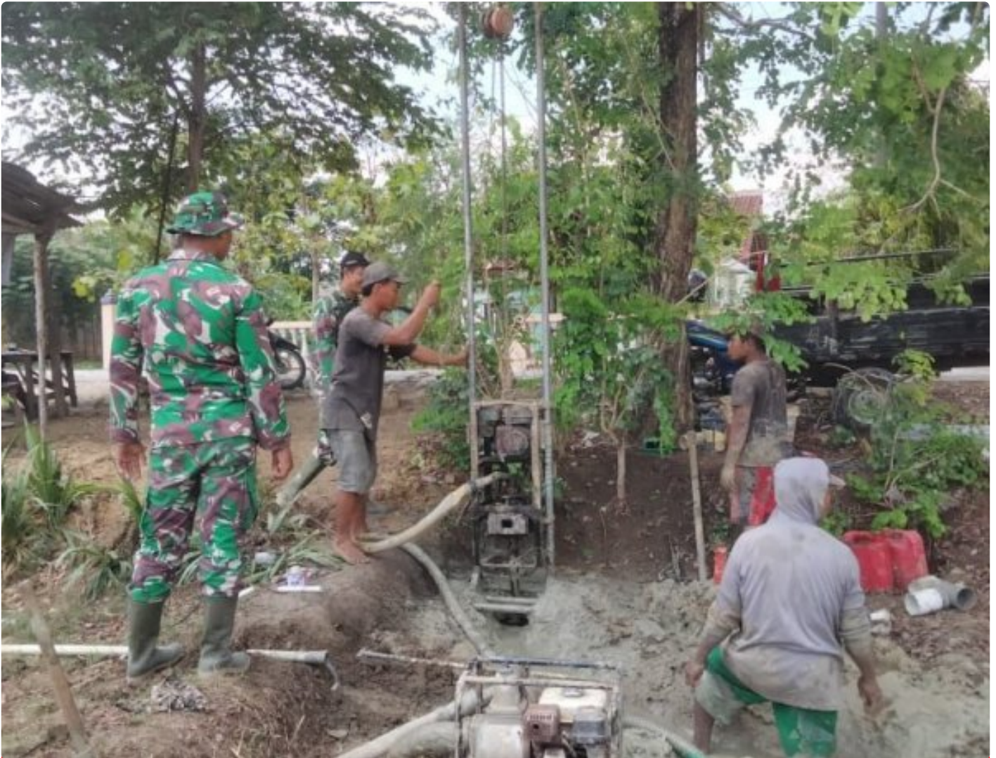
Foto: TNI Manunggal Air Bersih (TMAB) Program Unggulan Kepala Staf TNI Angkatan Darat (Kasad) Jenderal TNI Maruli Simanjuntak Menjadi Sasaran Tambahan Pada Pelaksanaan TMMD ke 122 tahun 2024 Kodim 0721/Blora di Desa Sidomulyo, Kecamatan Banjarejo, Kabupaten Blora Jawa Tengah, Rabau (2/10/2024).